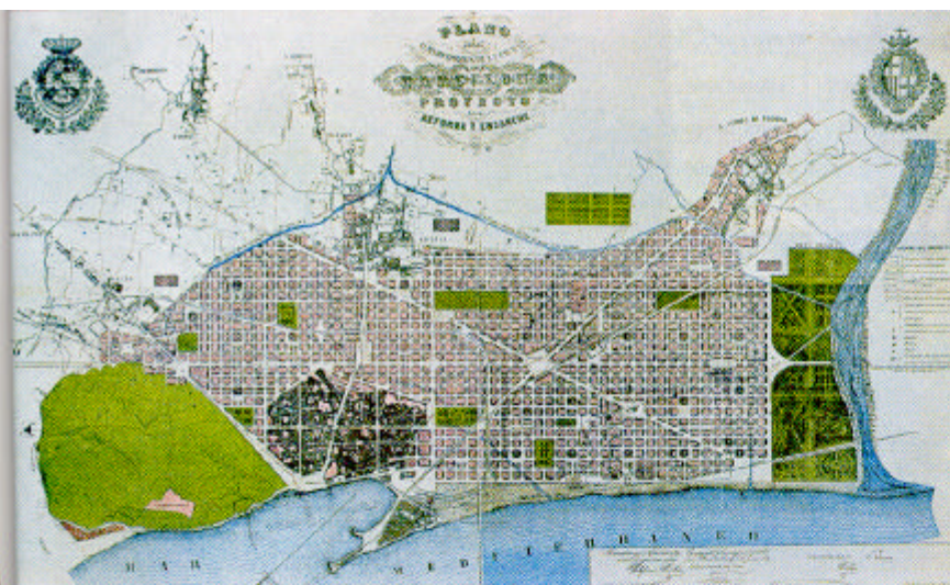
El plànol original del projecte d'Ildefons Cerdà.