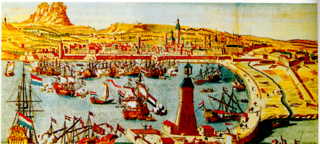
Vista de Barcelona al segle XVIII.