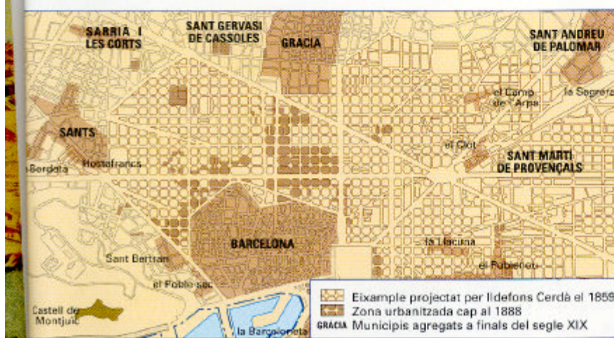
Pobles agregats a Barcelona, al final del segle XIX.