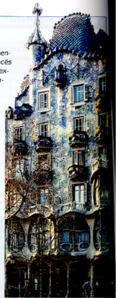
La Casa Batlló, d'Antoni Gaudí.